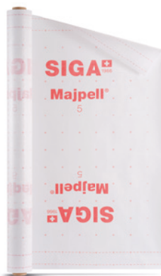
Majpell ® 5