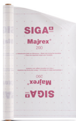
Majrex ® 200