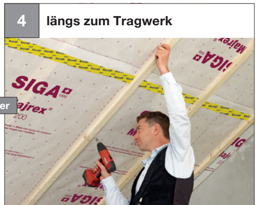
4 längs zum Tragwerk