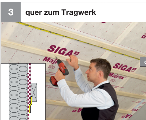
3 quer zum Tragwerk