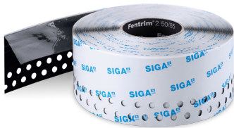
Fentrim ® 2 50/85