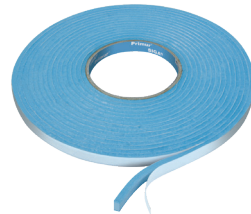
Primur ® roll