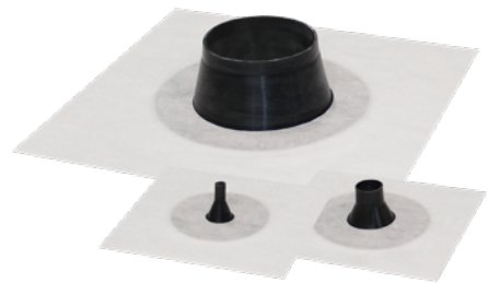
Fentrim® Manschette white S. 150