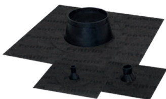
Fentrim ® Manchette black