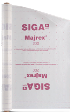
Majrex ® 200