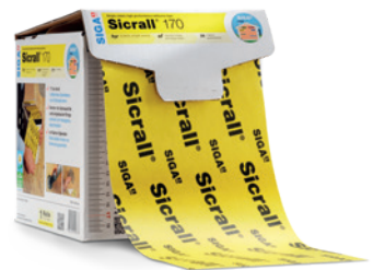
Sicrall ® 170