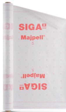
Majpell ® 5