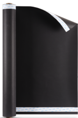
Majvest® 700 SOB