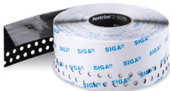
Fentrim® 2 50/85